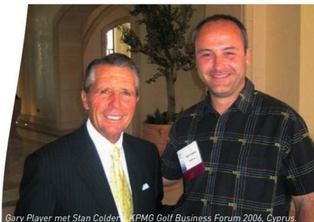
Gary Player met Stan Colders, KPMG Golf Business Forum 2006, Cyprus.

Mind:Style werkt zeer internationaal. Was België te klein?