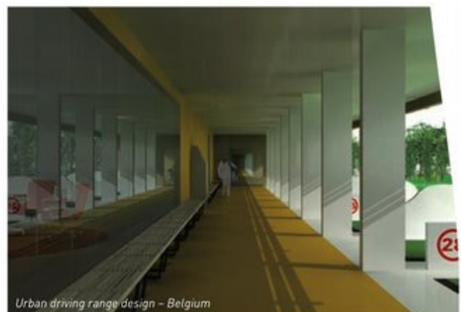
Urban driving range design - Belgium