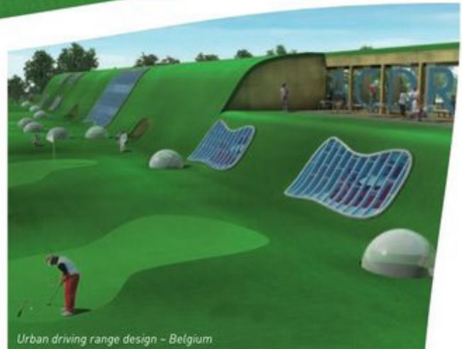
Urban driving range design - Belgium

Colders: We vertrekken vanuit de natuur. Daarin schuilen alle ingrediënten voor een rustgevende setting. Van ideale verhoudingen, over organische vorm-